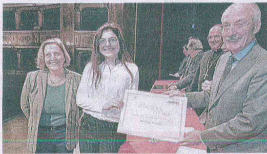
Il presidente della Carifermo Amedeo Grilli premia una studentessa

in un'edizione digitale per dare ugualmente il giusto riconoscimento agli studenti che si sono distinti nel corso degli anni. Oggi dalle 10 saranno premiati i ragazzi e le ragazze che hanno concluso il loro ciclo di studio, secondaria di primo e secondo grado, nell'anno scolastico 2020-2021. I 112 protagonisti con i loro familiari attivano al teatro dell'Aquila da 40 comuni e da 5 province per ottenere il riconoscimento del loro impegno. L'ingegnere Oronzo Mauro, ospite di stamattina racconterà storie di innovatori di ieri e di oggi ai possibili innovatori di domani. Di seguito pubblichiamo i nomi dei ragazzi premiati.