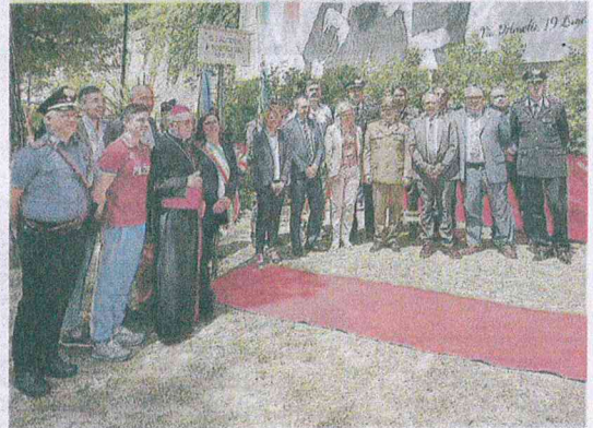
La cerimonia a Monsampietro Morico

Presenti le principali cariche civili e militari, ma, soprattutto – si diceva – tanti ragazzi, «sentinelle capaci di captare eventuali atteggiamenti mafiosi e intimidatori, come il bullismo». Tra gli ospiti Andrea Del Mastro, presidente della Giunta per le autorizzazioni a procedere della Camera, che ha ricordato il contributo di Giovanni Falcone e Paolo Borsellino all'introduzione del carcere duro. E che s'è