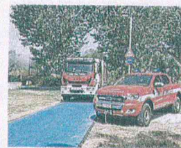
Paura a Lido Tre Archi