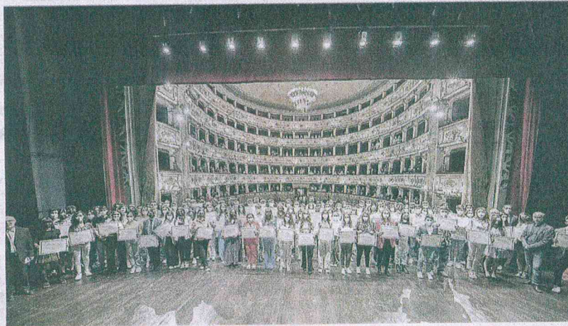
La tradizionale foto di gruppo al Teatro dell'Aquila al termine della manifestazione

Ribalta per 112 studenti di 5 province: «Che bello, ci ripaga per l'impegno»