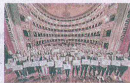
Una delle passate edizioni

Fermo, al teatro dell'Aquila torna l'iniziativa della Carifermo Spa rivolta alle scuole medie e superiori