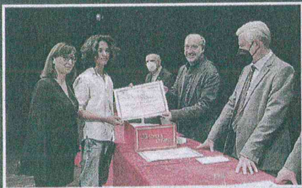
L'iniziativa di ieri mattina al Teatro dell'Aquila: il riconoscimento va agli studenti segnalati dalle scuole per profitto, capacità e impegno provenienti da 40 istituti.