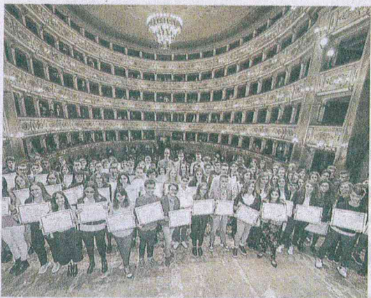
L'evento al Teatro dell'Aquila premia gli studenti migliori