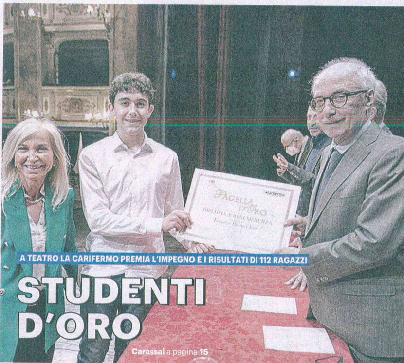
A TEATRO LA CARIFERMO PREMIA L'IMPEGNO E I RISULTATI DI 112 RAGAZZI

Sono passati 42 anni dal primo concerto. Il tour di addio si intitola 'L'ultimo girone', come hanno voluto Piero Pelù e Ghigo Renzulli, i due rimasti della formazione originale, che pur tra crisi, scioglimenti e cambi di line, hanno portato avanti l'avventura della band fino a oggi.