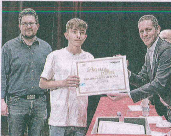
Alcuni momenti della cerimonia e, in alto, tutto il gruppo sul palco